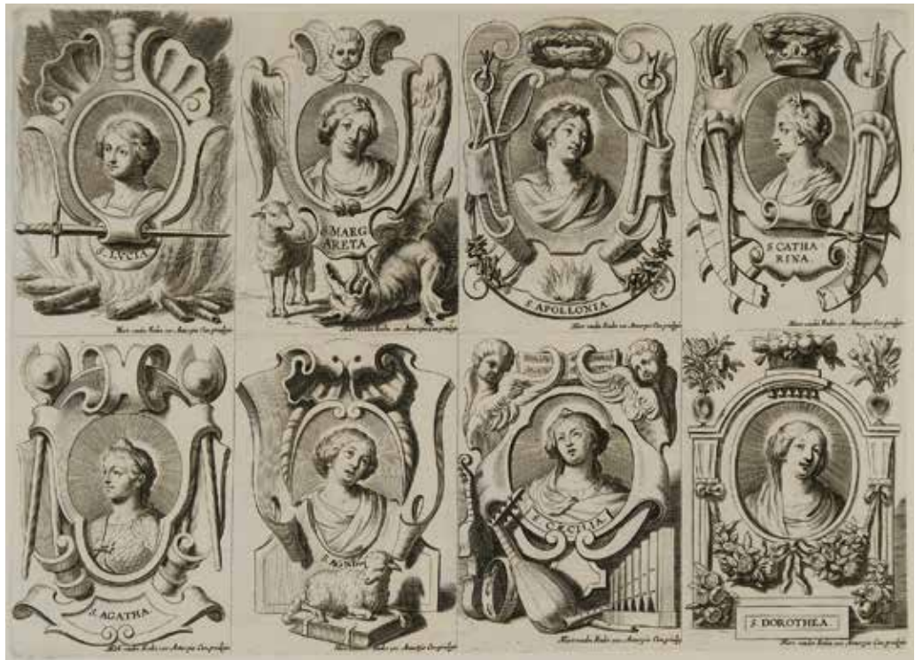
6 Martinus van den Enden (uitgever), Acht vrouwelijke heiligen (S. Lucia, S. Margareta, S. Apollonia, S. Catharina, S. Agatha, S. Agnes, S. Caecilia, S. Dorothea), gravure, 190 x 260 mm (per voorstelling 95 x 65 mm), Wolfegg, Kunstsammlungen der Fürsten zu Waldburg- Wolfegg, inv. 207-494 Bijlage E.1

tijd zijn er prenten bekend waarbij Jezus woont en werkt in het hart, hét symbool van de ziel van de gelovige. 33 Binnen deze laatmiddeleeuwse beeldcultuur was de meditatie gericht op een mystieke vereniging met Christus. De geleefde spiritualiteit is hoofdzakelijk bekend uit kringen van vrouwelijke mystici en heiligen. Tijdens de Contrareformatie werd rijkelijk teruggegrepen op deze mystieke beeldcultuur.