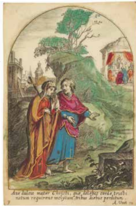
4 Alexander Voet (uitgever), Jezus in de tempel , uit: De zeven smarten van Maria , nr. 3, ingekleurde gravure op perkament, 93 x 64 mm, Utrecht, Museum Catharijne- convent, inv. OKM dp2284

van hoe eenvoudig en slordig prentjes werden nagesneden door kopiisten.