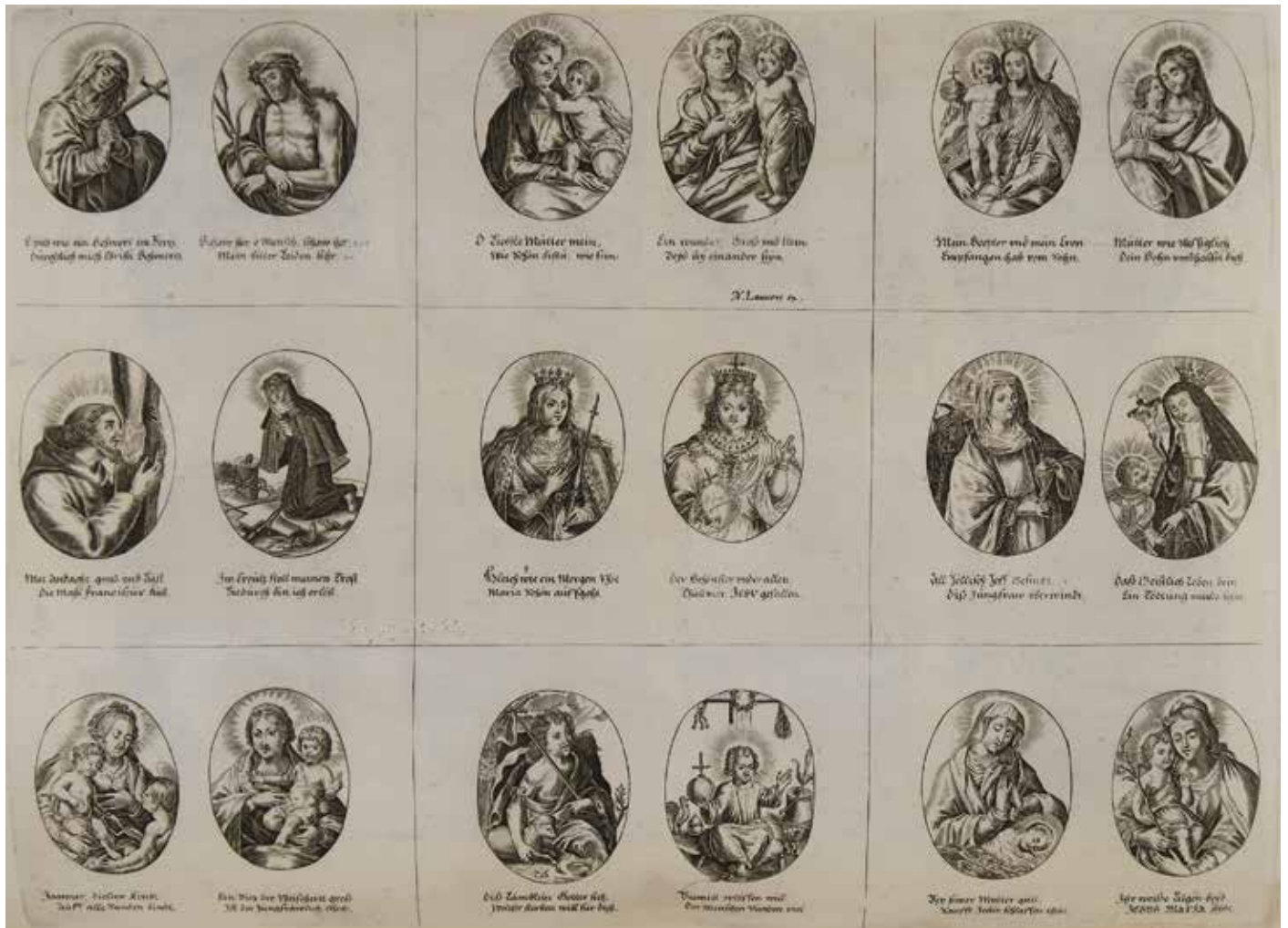
3 Nicolaes Lauwers (uitgever), Reeks met 24 voorstellingen van Christus, Maria en heiligen met Duitse onderschriften, gravure, 243 x 323 mm (per twee voorstellingen ca. 81 x 108 mm), Wolfegg, Kunstsammlungen der Fürsten zu Waldburg-Wolfegg, inv. 207-509 Bijlage L.8