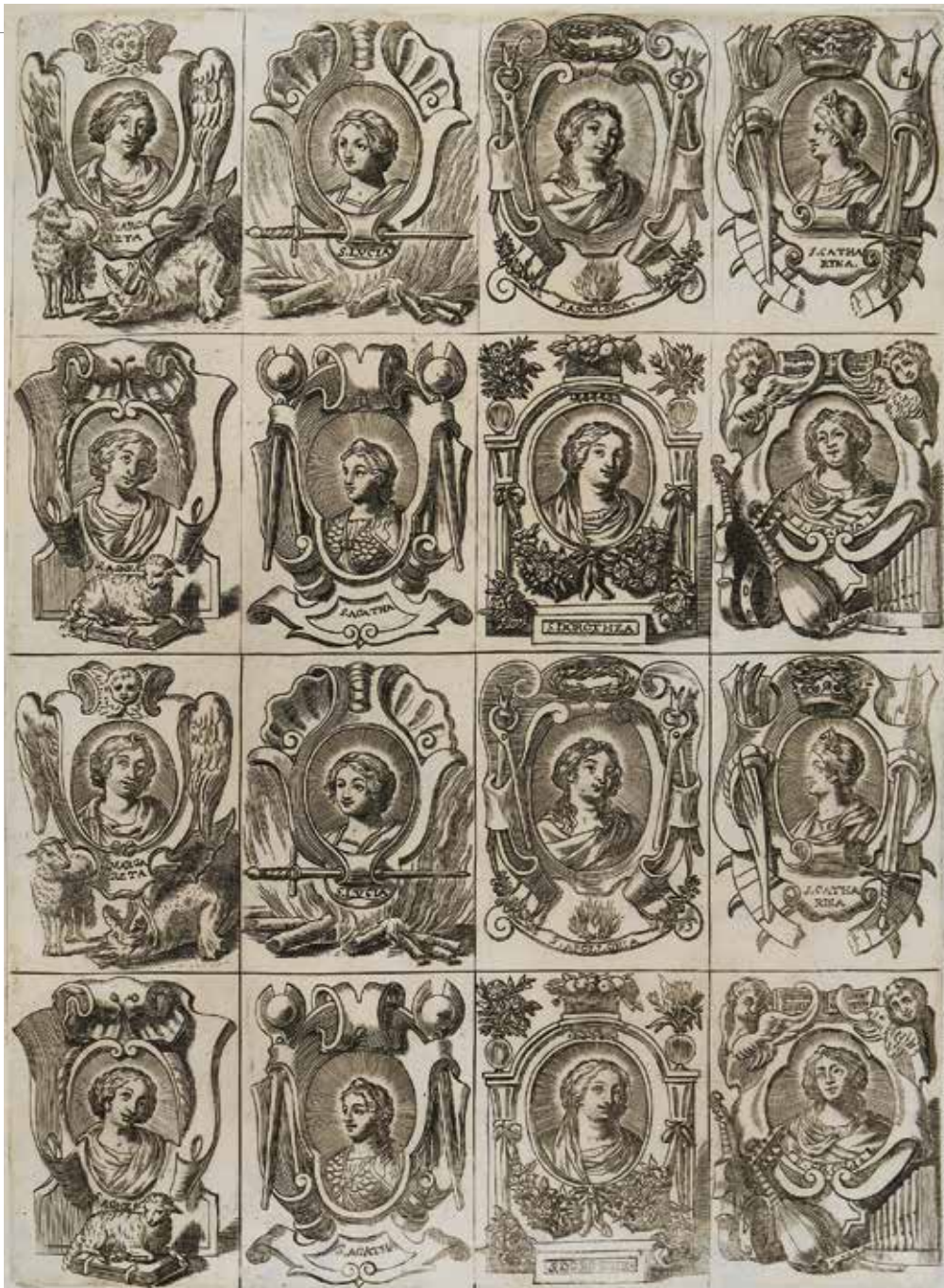
7 Anoniem, kopie naar een prent uitgegeven door Martinus van den Enden, Acht vrouwelijke heiligen (S. Margareta, S. Lucia, S. Apollonia, S. Catharina, S. Agnes, S. Agatha, S. Dorothea, S. Caecilia), tweemaal de reeks onder elkaar, gravure, 260 x 192 mm (per voorstelling 65 x 48 mm), Wolfegg, Kunstsammlungen der Fürsten zu Waldburg-Wolfegg, inv. 207-409 Bijlage E.4