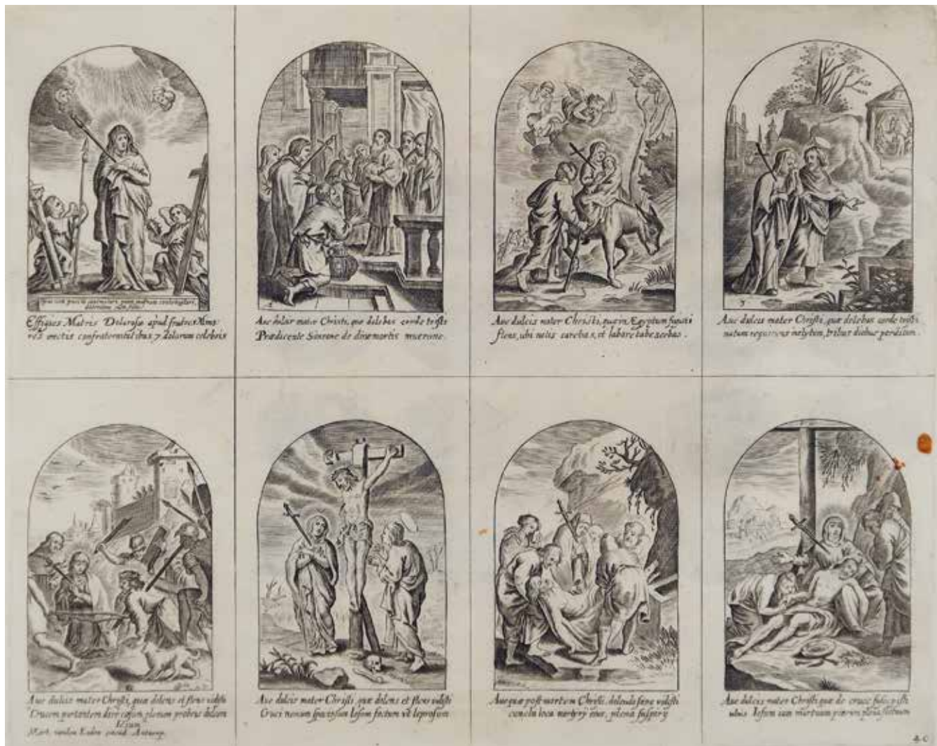
5 Martinus van den Enden (uitgever), Acht voorstellingen met De zeven smarten van Maria (Effigies Matris Dolorosae [...]) , nr. 04, gravure, 235 x 290 mm (per voorstelling 117,5 x 72,5 mm), Wolfegg, Kunstsammlungen der Fürsten zu Waldburg-Wolfegg, inv. 221-226 Bijlage E.14