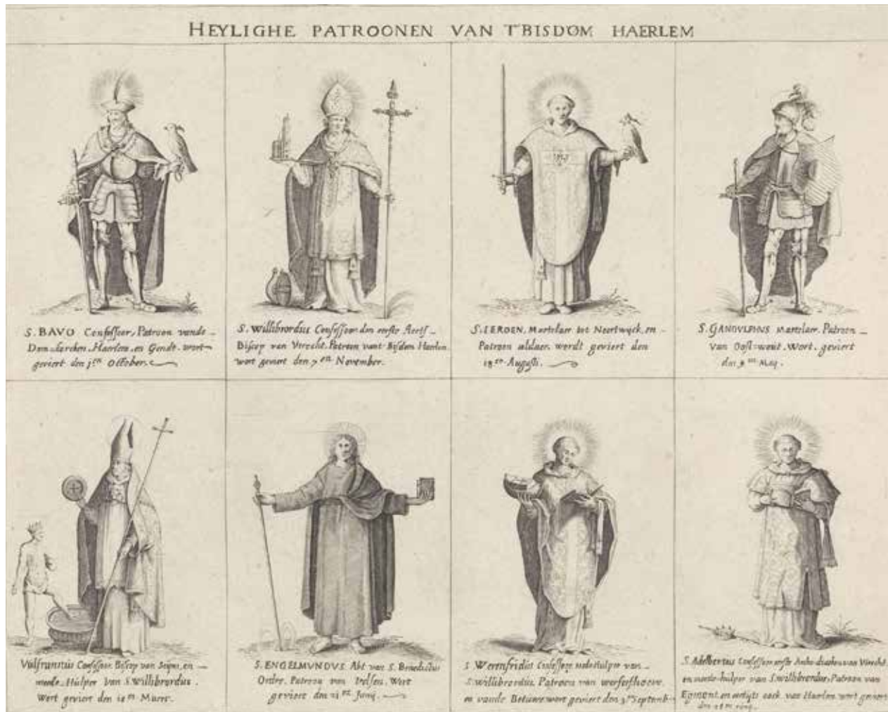
10 Jacob Matham (ontwerp), mogelijk door Jan van de Velde II, Heylighe Patroonen van 't Bisdop Haerlem , 1632, uit een reeks van drie onversneden bladen, gravure, 193 x 241 mm (per voorstelling 90 x 60 mm), Amsterdam, Rijksmuseum, inv. RP-P-1898-A-20554